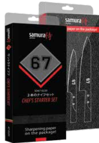
SS67-0220 DREI MESSER-SET SS67-0010, SS67-0023, SS67-0085