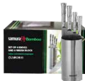
SBA-05 VIER MESSER-SET SBA-0010, SBA-0021, SBA-0045, SBA-0085 UND BÜRSTENHALTER