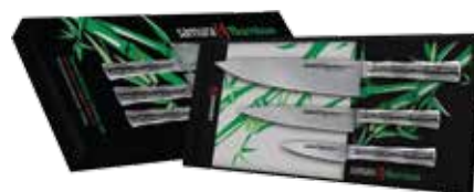
SBA-0220 DREI MESSER-SET SBA-0010, SBA-0023, SBA-0085

Hygienische fugenlose Leichtmetallbefestigung ist für die Spülmaschine geeignet