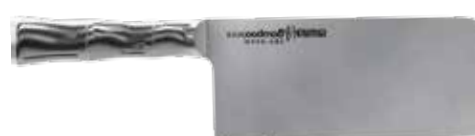
SBA-0040 HACKMESSER 180 MM/7,0"